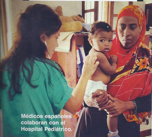
Médicos españoles colaboran con el Hospital Pediátrico.